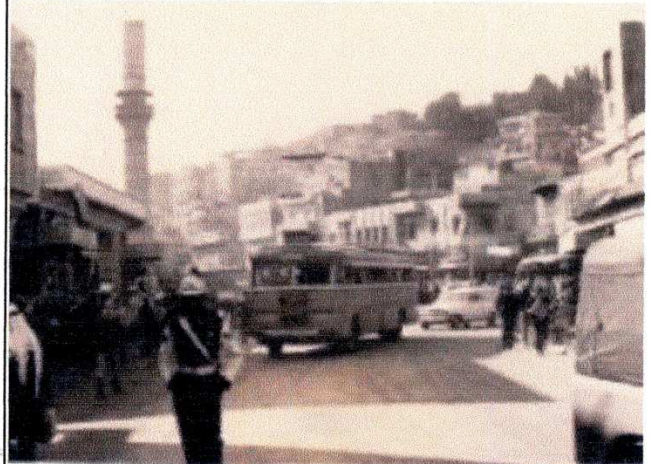
一九六七年第3次中東戦争直後のアンマン市中心街

アンマン市街には未だ戦争ムードが溢れ、勇ましい戦車の隊列が目の前を通り過ぎて行った。市内のあちこちに銃を構えた兵士たちの警戒の目が光っていた。戦争はほんの6日間で止んだが、戦時色丸出しの街中を歩くには、後から思えばもっと用心深い警戒心が必要だった。だが、若気の至りで怖いもの知らずだった当時の私は、無警戒にもカメラを肩にホテルから路地裏を駆け抜けると見晴らしのいい小高い丘の上へ躍り出た。